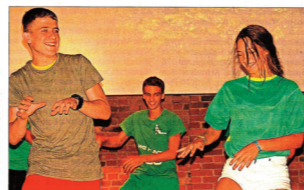
Viel Spaß hatten Jugendliche bei der Aufführung.