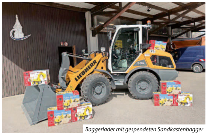
Baggerlader mit gespendeten Sandkastenbagger