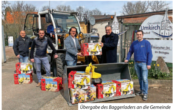
Übergabe des Baggerladers an die Gemeinde