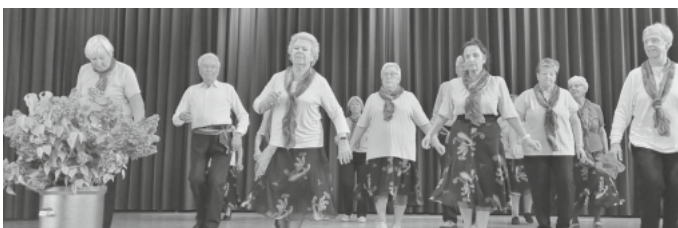
Mit Schwung: Tanzkreis des Roten Kreuzes